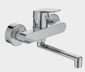
CERAFLEX MIX LAVELLO PARETEBOCCA 200MM