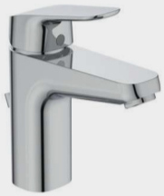
CERAFLEX MISCELATORE LAVABO