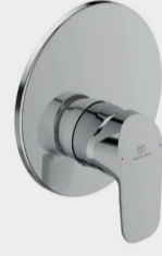
CERAFLEX MIX INCASSO DOCCIA