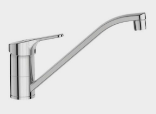
CERAFLEX MIX LAVELLO BOCCA ORIENTABILE