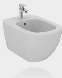
TESI BIDET SOSP. MONOF. +FISS. NASC. BN