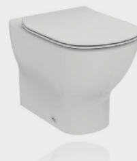
TESI VASO WC UNIV. FILO PAR. +SEDILE RALL. BN