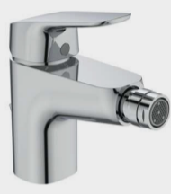
CERAFLEX MISCELATORE BIDET