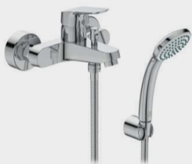
CERAFLEX MIX ESTERNO VASCA/DOCCIA