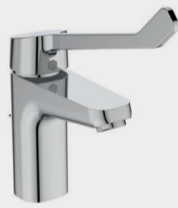
CERAFLEX MIX LAVABO LEVA CLINICA