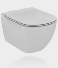
TESI WC SOSP.+AQUABLADE +SED. SLIM BN EUR