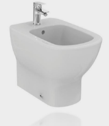
TESI BIDET BTW MONOF. BN